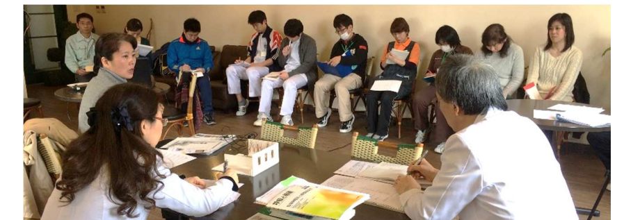
研究の全体ミーティング

ダンス、わかばハウス、わかばテラスの入居者に、里山療法 認知症非薬物療法（の一環としてご協力いただき、日本庭園鑑賞前と鑑賞後のデータを基に、日本人認知症高齢者への日本庭園における美的要素の有効性について解析することを目的としています。4月上旬より着工した造園工事も無事に終了し、病院、わかばテラスとも素晴らしい日本庭園が完成しました。今後この庭が、患者様や入居者様の癒しの空間となることを願っています。