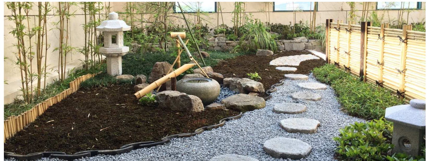
俵町浜野病院7階 日本庭園