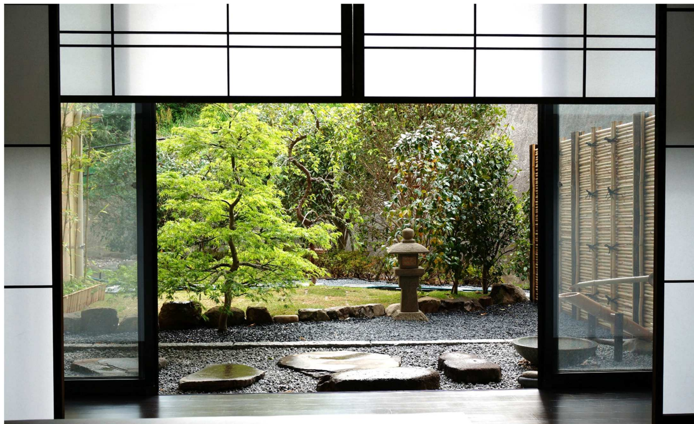
わかばテラス 日本庭園

●5月の第2週目の日曜日は「母の日」、家族のために尽くしてくれる「お母さん」をねぎらい、感謝の気持ちを表す日です。1907年、アメリカに住んでいた女性、アンナ・ジャービスが、自分を懸命に育ててくれた母の死を悼み、母親が好きだった白いカーネーションを教会に飾ったのが発端とされています。母の日には、母親が元気な場合は赤いカーネーションを、亡くなっている場合は白いカーネーションを胸に飾るようになり、やがてプレゼントとしてカーネーションを贈る風習へとつながっていったそうです。