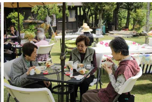
わかばテラス サンドイッチランチ