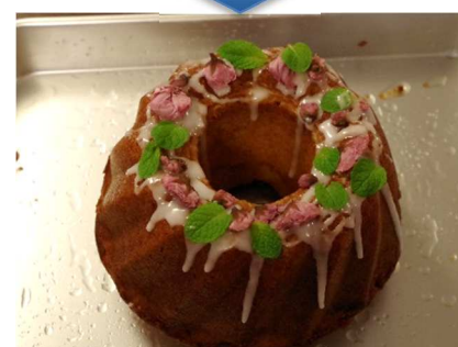
さくらのクグロフケーキ