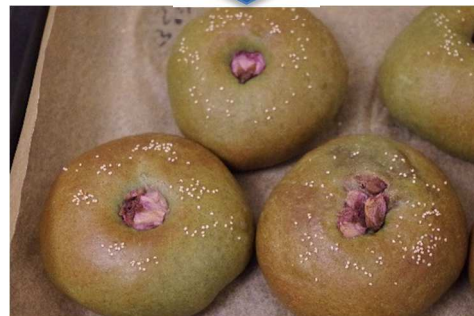
さくらのよもぎアンパン