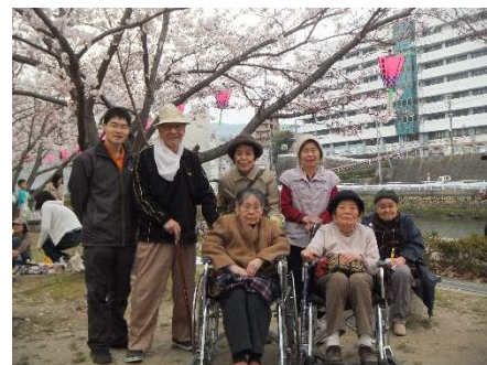
わかばレジデンス お花見