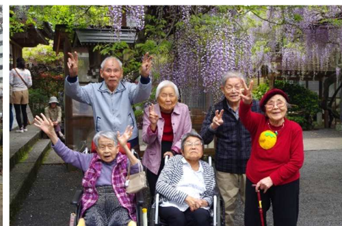
里山療法クラブ 藤山神社見学