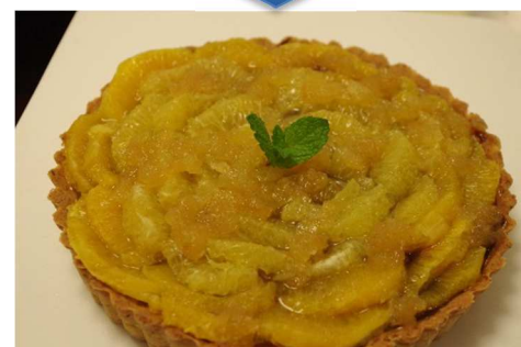
オレンジ紅茶タルト