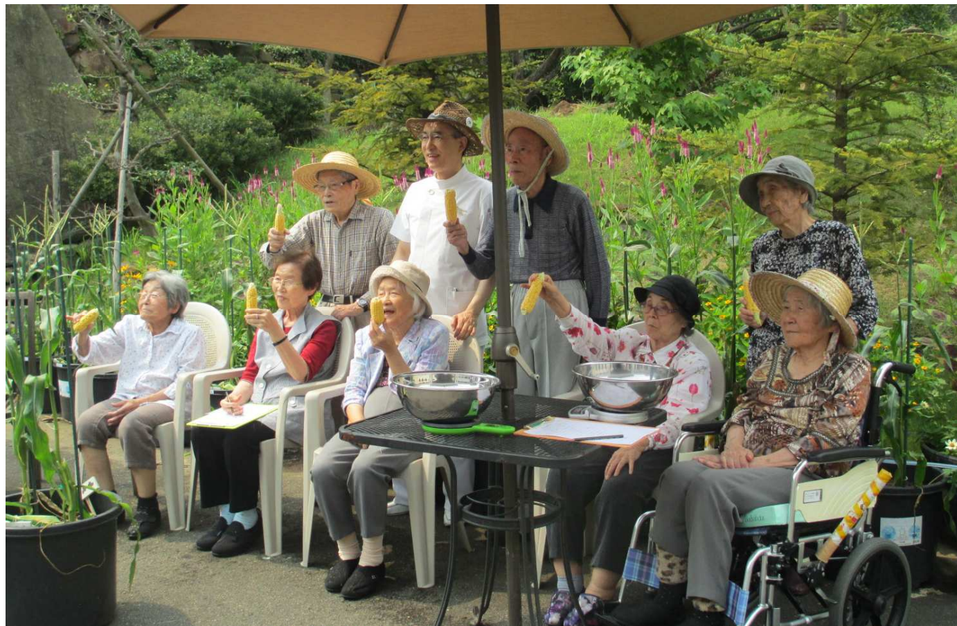
わかばテラスでのトウモロコシの収穫

編集・発行／医療法人わかば会 〒857-0016 佐世保市俵町 22-1 Tel 0956-22-6548 Fax 0956-24-7270 http://www.wakabakai.or.jp