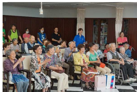
声援を送る入居者

夜間や休日の時間外診療は、あくまでも緊急の対応ですので、できるだけ診療体制の整った平日昼間に受診し、体調がすぐれないときは、早めにかかりつけ医を受診しましょう。