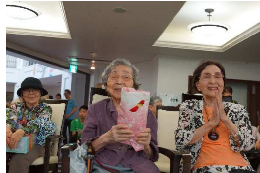
抽選会で景品ゲット