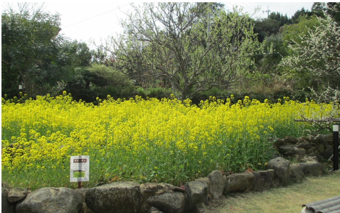
わかばテラスに咲く 菜の花

編集・発行／医療法人わかば会 〒857-0016 佐世保市俵町 22-1 Tel 0956-22-6548 Fax 0956-24-7270 http://www.wakabakai.or.jp